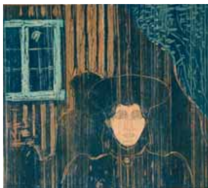
Edvard Munch – Måneskinn

Ønsker du å selge? Ta kontakt på 22 99 10 10 eller galleri@kaare-berntsen.no for en uforpliktende verddivurdering og salgssamtale. Siste frist for innlevering er 10. september.