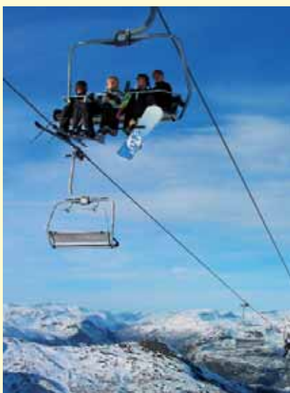
LA BILEN STÅ: Høsten 2009 blir det heisforbindelse fra Hemsedal sentrum opp til skianlegget.